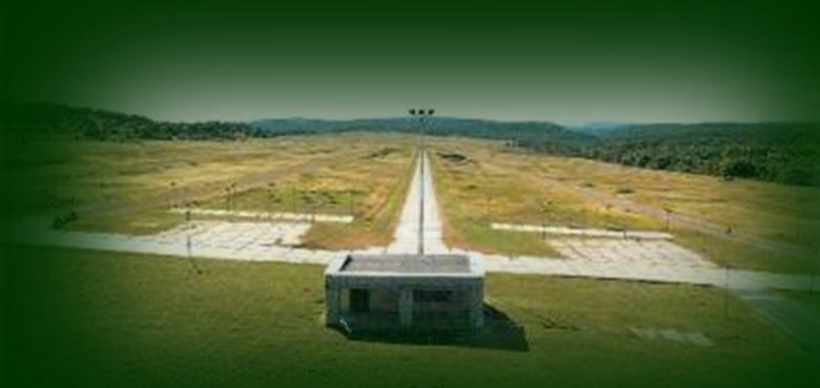
CVIČISKÁ / TRAINING GROUND