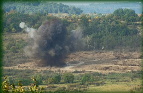
STRELNICE / SHOOTING RANGE